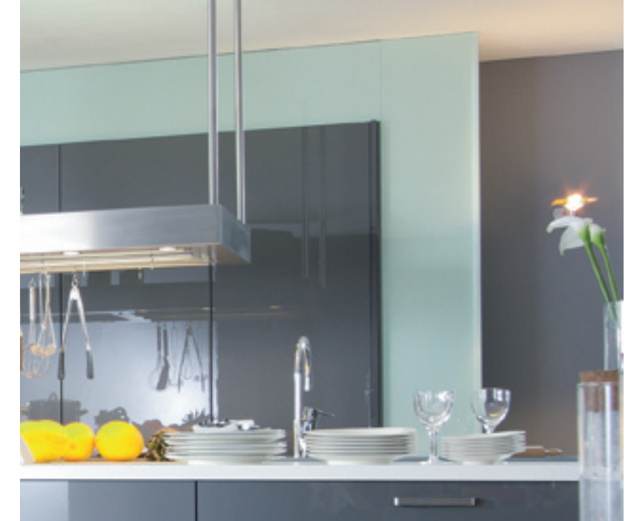
Joceline Busch Interieurdesign, Lengerich (D), Foto: Schembecker Fotodesign

Mutig, lebendig und voller Licht. Feuerrot ist der Inbegriff von „designer red“, einem Trend im Innenausbau.