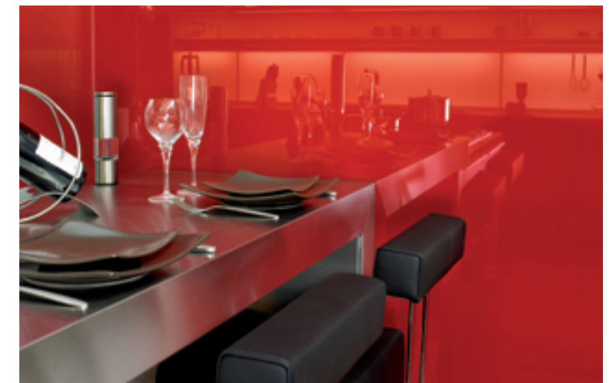
Intérieur d'aujourd'hui, Paris (F)