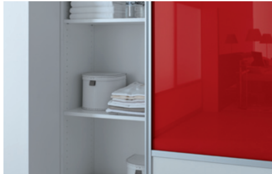
Studio CASA, Münster (D)

SGG PLANILAQUE EVOLUTION ist ein lackiertes Floatglas mit einer opaken, farbigen Oberfläche. Dazu wird auf die Rückseite des Glases ein deckender, hochwiderstandsfähiger Lack aufgebracht und eingehärtet.