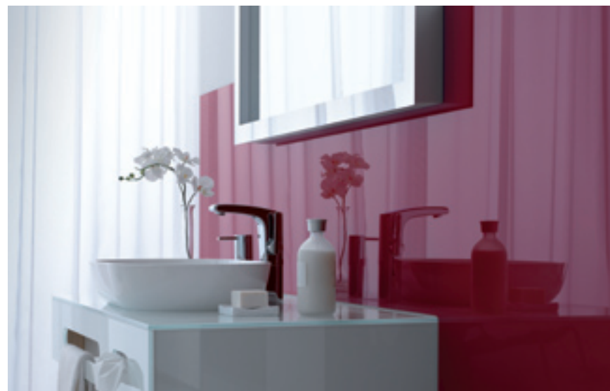
Studio CASA, Münster (D)