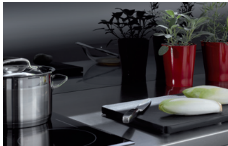
Studio CASA, Münster (D)