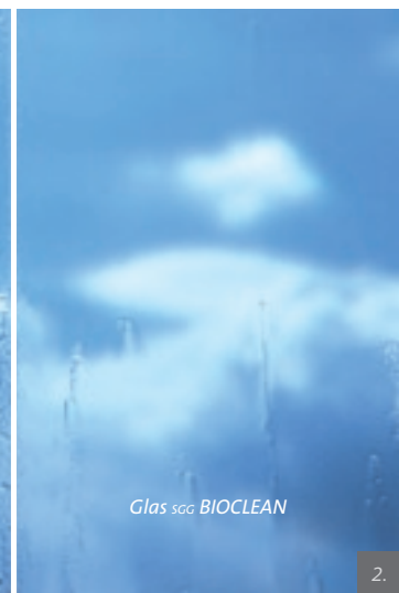
Glas SGG BIOCLEAN